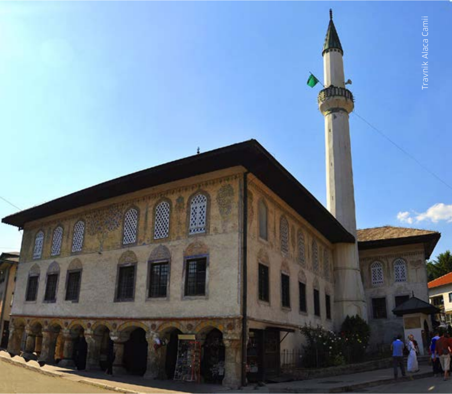
Travnik Alaca Camii

pılmaktadır. Buradaki eğitim normal milli eğitimin süresi içinde yapılmaktadır yani eylül-haziran ayları arasında gerçekleştirilmektedir. Çocuk okuluna sabahtan gidiyorsaveya birinci öğretimse öğleden sonra camideki dini eğitime devam etmekte, eğer ikinci öğretimse öğleden önce dini eğitimine iştirak etmektedir.