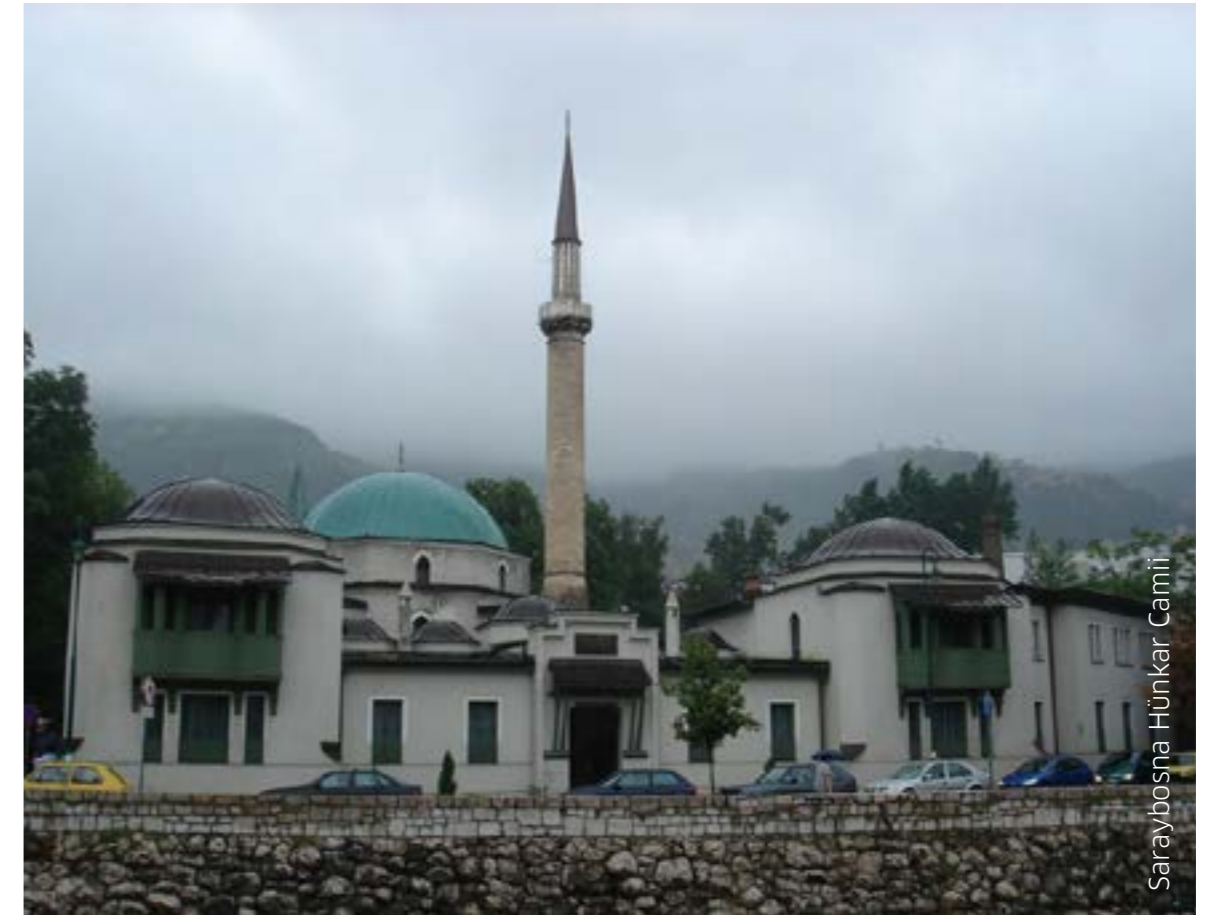
Saraybosna Hünkar Camii

Omerdiç, Muharem, Priloziñucavanja-GenocidanadBosnjacima (1992-1995). Boşnaklara Yapılan Soykırım Araştırmalarına Katkılar. Zlatar, Behija, Gazi HusrevBeg, Sarajevo, 2010. Alparslan, Şenol, Bosna'da Türk Kültürünün İzleri, Ankara, 2008. http://balkans.aljazeera.net/vijesti/podsjecanje-na-614-dzamija-poruse-nih-u-bih